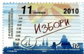
Pulla postare e Postës së Maqedonisë me rastin e 20 vjetorit të zgjedhjeve të para shumëpartiake në Maqedoni

Zgjedhjet e para parlamentare janë zhvilluar në vitin 1994, pas shpalljes së pavarësisë së Republikës së Maqedonisë në vitin 1991.